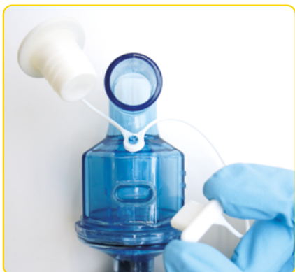
Ujistěte se, že jsou víčka odstraněna