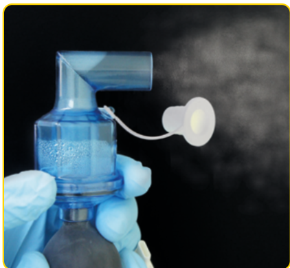
Měli byste vidět jemnou mlhu